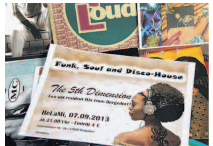
Semi-professionell und kreativ: Flyer und Plakate drucken und verteilen die DJs selbst, gestalten und dekorieren den Clubraum.