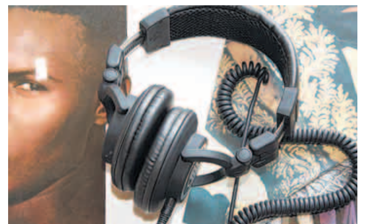
Ohne Kopfhörer geht gar nichts: Weiche Übergänge und gekonntes Mischen gehören zum Geschäft eines guten DJs.