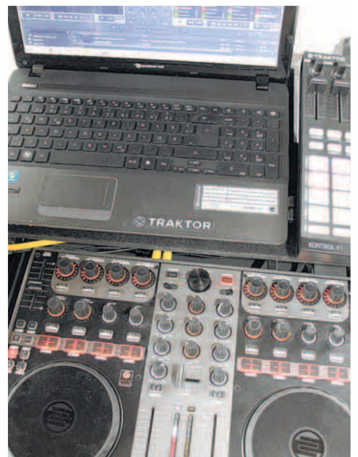
Die beiden „Residents“ der alten Schule sind längst mit allem ausgestattet, was ein DJ im digitalen Zeitalter so braucht.